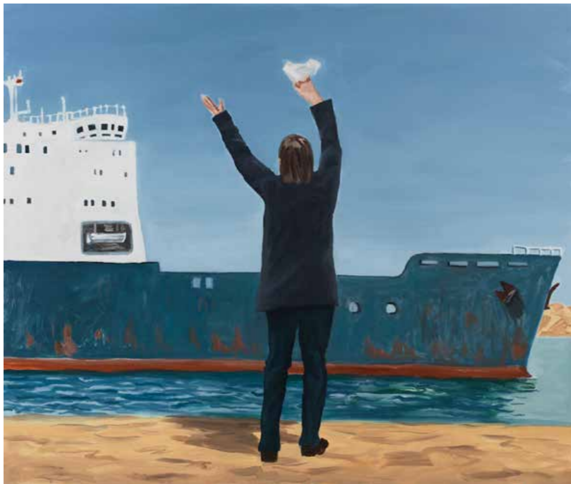
Richard Bosman, Sailors Return , 2013